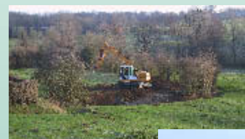
The digging of a traditional grassland pond.

A pond development and restoration programme is allowing greater biodiversity. Many of these ponds have disappeared since World War II.