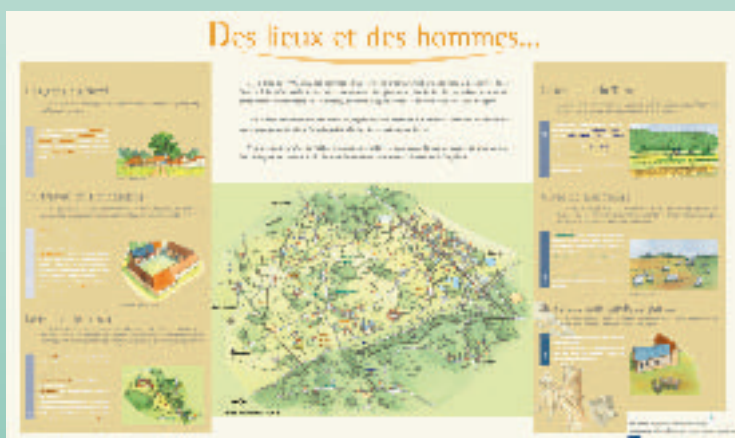
The landscape place names information panel at Longfossé.

The installation of heritage information panels