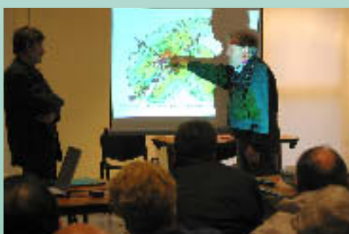
A public meeting concerning landscape planning study at Echingham.

Following trials in certain communes, the Regional Natural Park is able to offer an "aid to decision making" tool to communes and inter-communal councils to help in the definition of landscape layout and development projects. A landscape and environment study allows local communities to plan their own development, taking account of local identity and character.