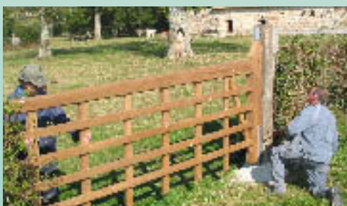
The erection of a traditional grassland fence.

Rural landscape development funding is available for the restoration of wooded areas, water channel projects so as to prevent soil