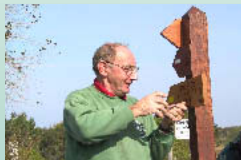
Installation of wooden signposts.

The creation and improvement of new circular walks.